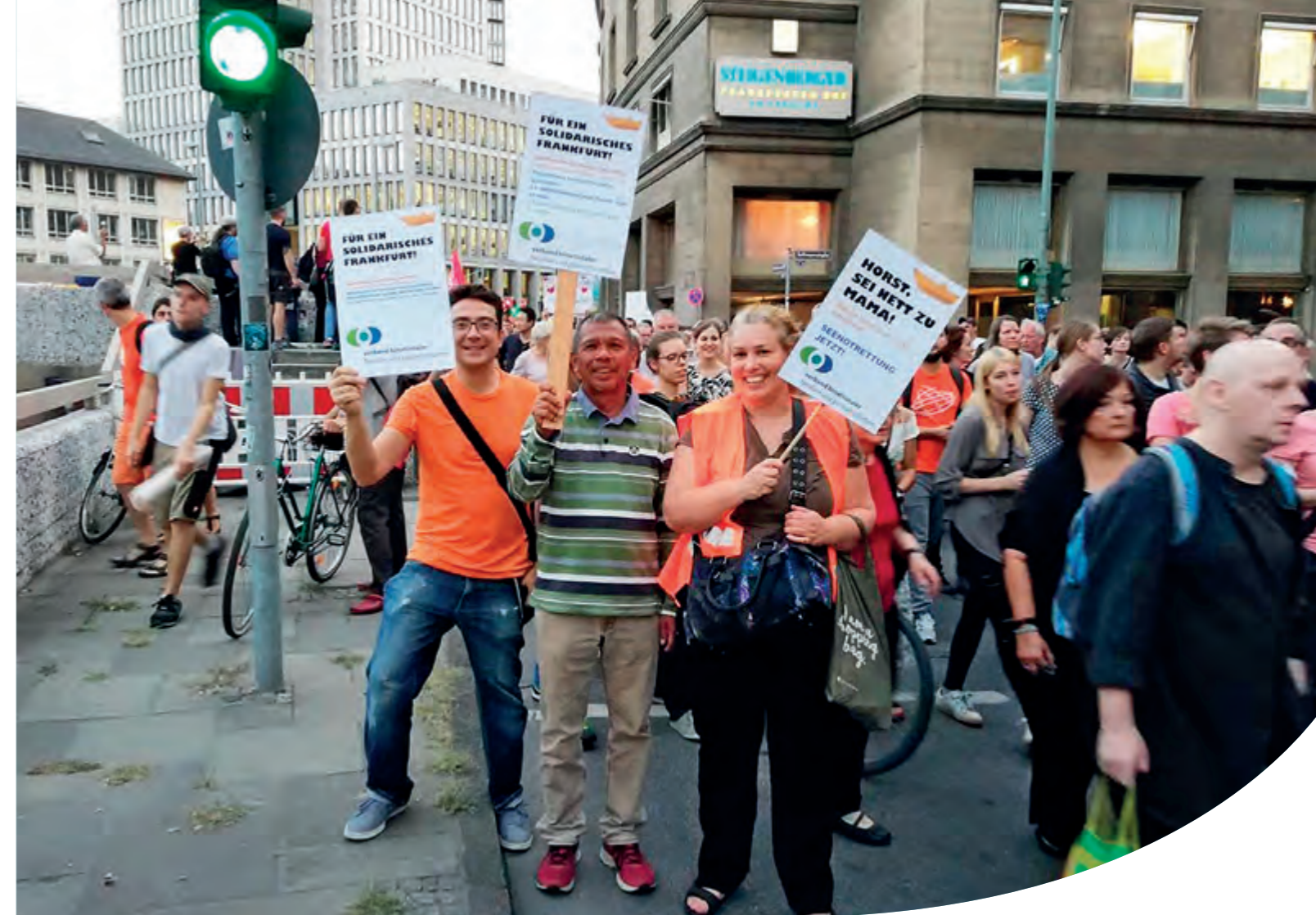
17. September 2018: Demonstration »Sei kein Horst – Seebücke statt Seehofer in Frankfurt« Der Verband binationaler Familien und Partnerschaften beteiligt sich aktiv.

Familienleben ist ein Grund- und Menschenrecht – dies stellt ernstlich niemand in Frage. Die gesetzlichen Vorgaben sehen daher Rechtsansprüche auf Familiennachzug vor, allerdings nicht für alle Familien. Hinzu kommt das Verwaltungshandeln, durch das die antragstellenden Personen oft den Eindruck gewinnen, eher Bittsteller als Inhaber von Rechten zu sein.